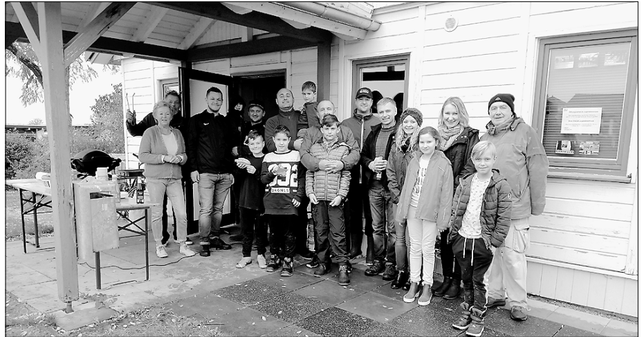
Fleißige Helfer bei der Taläcker-Putzete.

Die Taläcker-Putzete am 19. Oktober 2019 wurde erfolgreich durchgeführt. 12 Kinder der Freien Schule Anne-Sophie und 35 Bürger der Taläcker haben aufgeräumt. Abfall aller Art wurde eingesammelt und alle, egal welchen Alters, waren mit Begeisterung dabei und haben sich für das Wohngebiet und die Umwelt engagiert. Hinterher gab's wie immer im Jugendblockhaus ein leckeres Grillsteak sowie Bratwurst und gute Gespräche. All diejenigen, die noch nicht mitgemacht haben, sind für die Frühlingsputzete im April schon jetzt recht herzlich eingeladen. Der Bürgertreff Taläcker e.V. dankt allen Helfern von Herzen.