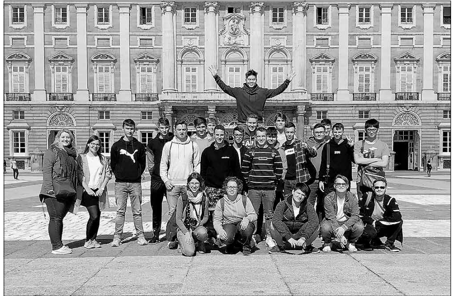
Die Klasse 12 des Technischen Gymnasiums der Gewerblichen Schule Künzelsau vor dem Königlichen Palast in Madrid.