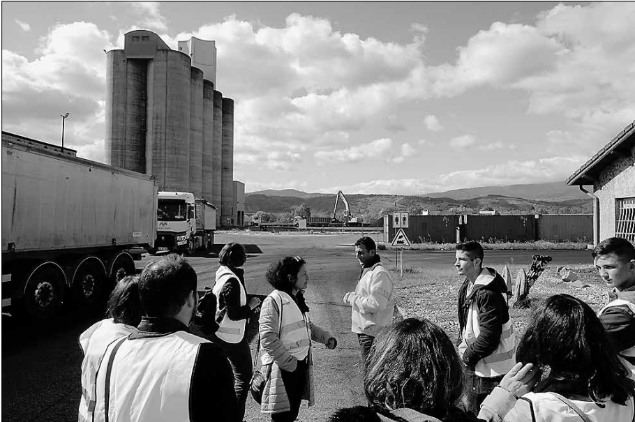
Die Schülergruppe bei einer Führung durch die multimodale Logistikplattform für Wasser, Schiene und Straße im Hafen von Vienne-Sud Salaise.